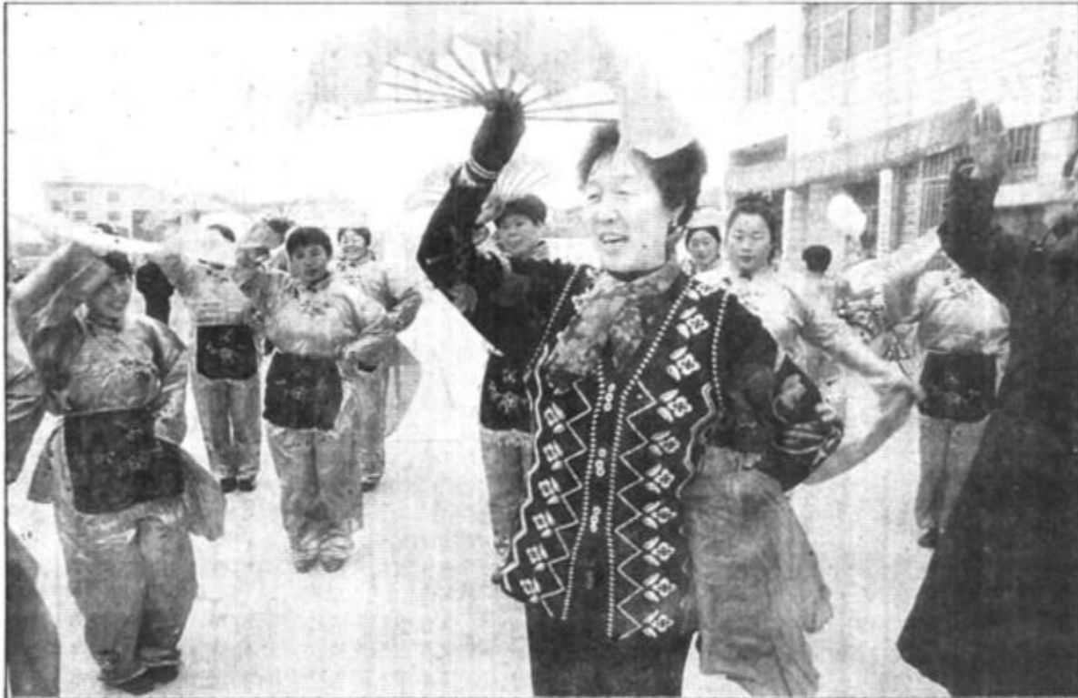
组稿编辑 金华善 本版校对 丁建军

集中发展以中华绒螯蟹为主体的名优水产品养殖，获得了高额效益。仅去年一年的时间，全区新增养殖面积1.5万亩，其中，新增蟹池0.7万亩，鱼池0.3万亩，贝类护养0.5万亩，养殖总面积已突破6.5万亩，水产品总产量达到了4.69万吨，胜利镇河蟹养殖亩亩年均创收都在3万元以上，使昔日的不毛之地成为今天的聚宝盆。该区以新苗培育带动水产品种优化，新增育苗水体1000立方米，成功培育优质河蟹大眼幼体300余公斤，被省内外众多客商争相购买，胜利镇成为全市首家省级河蟹良种场。在养殖结构上，该区以科技和市场为主导，持续进行战略性调整，全区36座重点水库全部实行了精料分投、管理方便、产量效益居高的网箱、网围或网栏养殖，一库多用，实现了综合、高效养殖。 东营区围绕牧渔产业的高速发展，加大了科技推广力度。“金农工程”顺利实施后，该区实现了乡镇及农业部门的联网，把农业科技、市场信息及时传递到千家万户，促进了农业产业的科技化转变。（张保华 张成华）